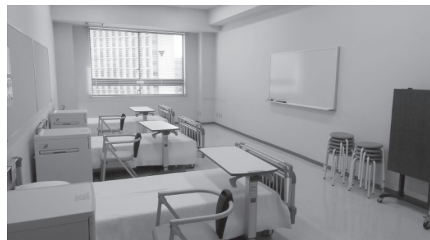
写真1 アーツールーム3（ベッド3床）

実習室のベッドが「不足していた」と回答した学生は25%であり、昨年度の47%から大幅に減少した。昨年度