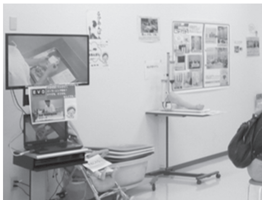
写真3 白楊祭企画～実習室教材の展示～