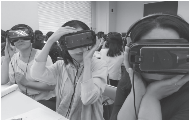
図2 老年看護学講義でのVRを用いた認知症の体験

学生にとっては、より多くの教員が相談窓口を担うことにより、日々の授業や実習、就職活動に関する幅広い支援を得ることができる利益もあると推察される。緊急の対処や特に注意を要するケースでは、関連する他の教員等と一層密に情報を共有し適切な支援ができるよう今後とも努めるとともに、学士編入生のカリキュラム特性等を踏まえ、現在のアドバイザー制度を利用した学士編入生の支援策を検証することが必要である。