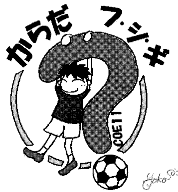
図1 シンボルマーク (瀬戸山陽子作)