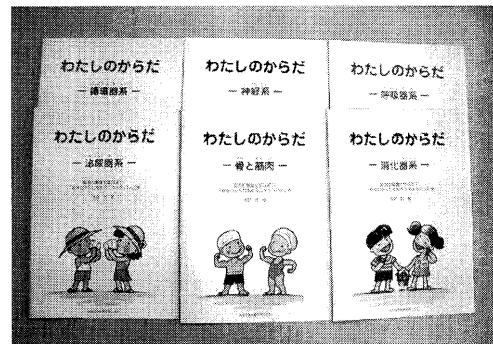
図2 絵本「わたしのからだ」

た。また、子どもの安全に配慮し、会場の収容人数(約400名)を下回る200名を定員とした。