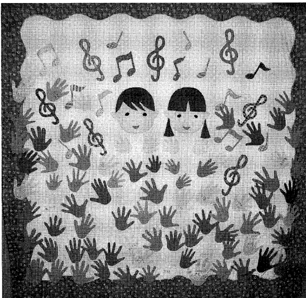
図4 シンボルキルト