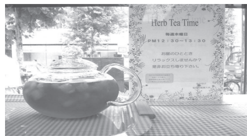
ギターやハーブ、落語など様々な催しが楽しめるミニコンサート