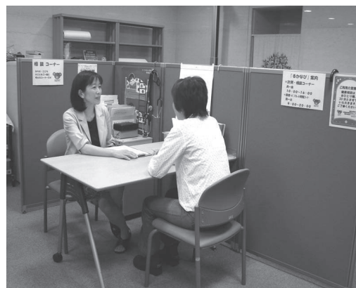
豊かな経験をもつ専門職がご相談にのります

医療専門職が、健康や病気に関する悩みや相談について、一対一でお話を伺い、一緒に考えます。