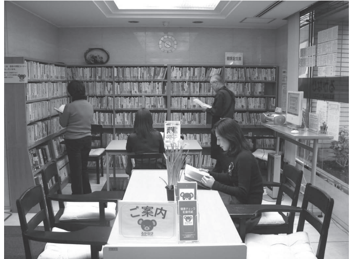
豊富な蔵書の中から選べる闘病記コーナー

1500冊以上の闘病記があります。読みたい本が探しやすいように病気別に分類しており、闘病記検索用のパソコンではそれぞれの本の目次も見るができます。貸し出しは行っていませんが、閲覧できるスペースをご用意しています。