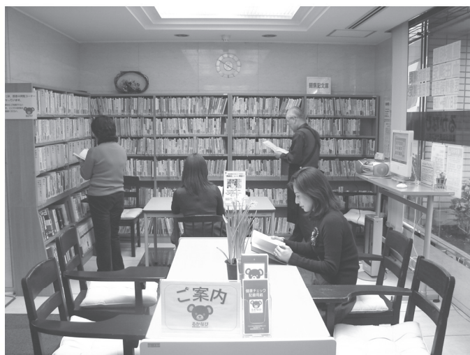
豊富な蔵書の中から選べる闘病記コーナー

1500冊以上の闘病記があります。読みたい本が探しやすいように病気別に分類しており、闘病記検索用のパソコンではそれぞれの本の目次も見るができます。貸し出しは行っていませんが、閲覧できるスペースをご用意しています。