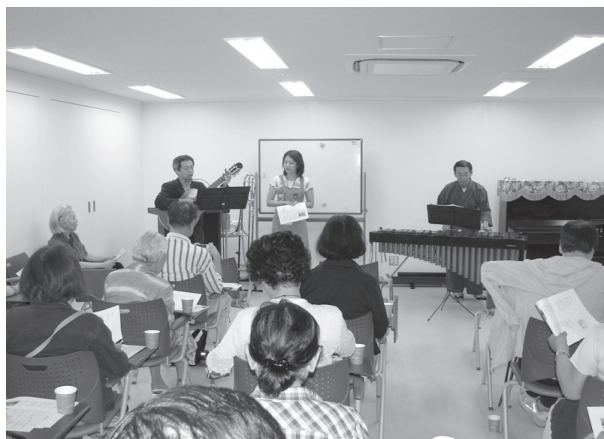
ギターやハーブ、落語など様々な催しが楽しめるミニコンサート