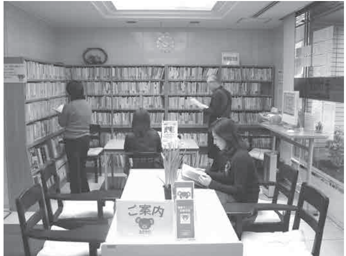
豊富な蔵書の中から選べる闘病記コーナー

1500冊以上の闘病記があります。読みたい本が探しやすいように病気別に分類しており、闘病記検索用のパソコンではそれぞれの本の目次も見ることができます。貸し出しは行っていませんが、閲覧できるスペースをご用意しています。