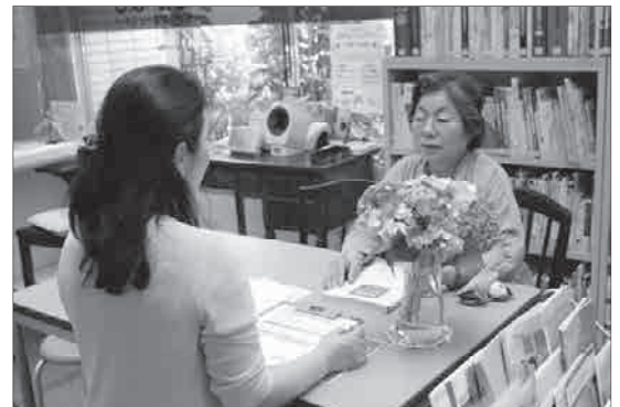
豊かな経験をもつ専門職がご相談にのります

医療専門職が、健康や病気に関する悩みや相談について、一対一でお話を伺い、一緒に考えます。