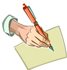
アンケートに回答する