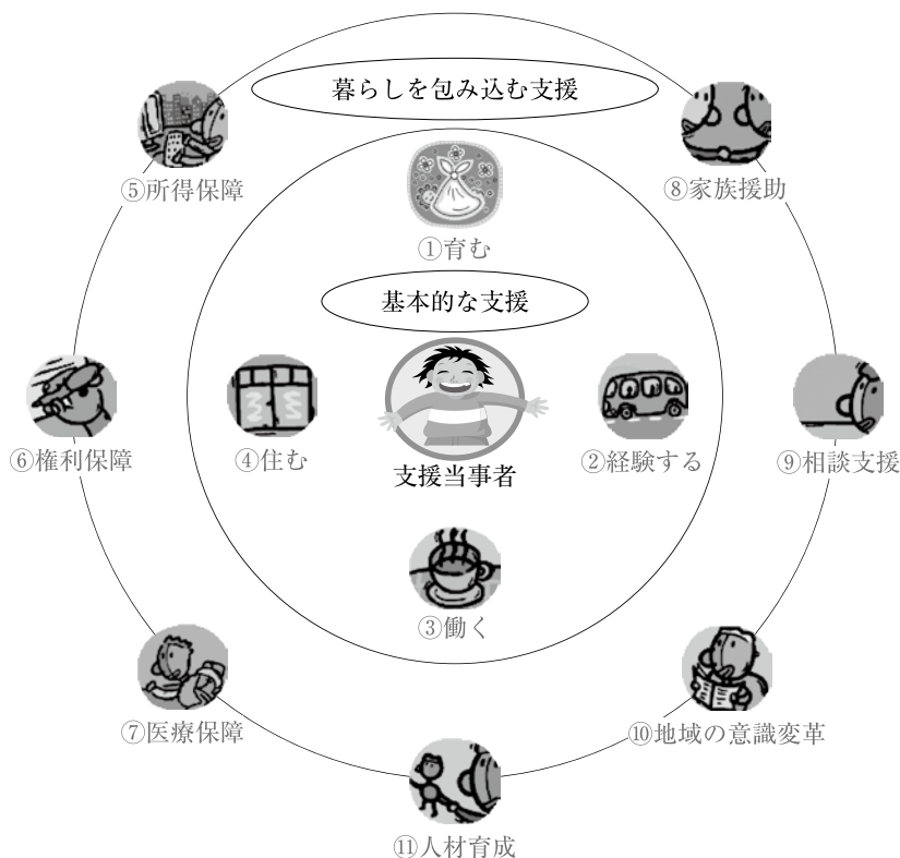
図1 地域生活支援：11個のパーツ

施設＝大きな人数で、社会に支援を受けながら暮らす。 在宅＝小さな人数で、家族に介護を受けながら暮らす。 地域＝小さな人数で、社会に支援を受けながら、自分