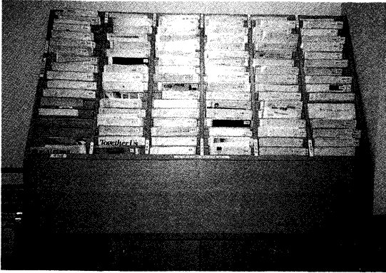
写真1 求人用資料閲覧用棚